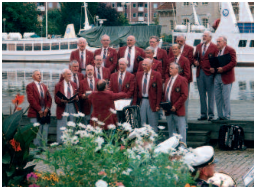
Uddevallavarvets sängkör, en bidragsmottagare med anknytning till Thordénstiftelsens ändamål att bl a främja intressen "som beröra de anställda vid Uddevalla-varvet och Sörviksvarvet." Här ett framträdande vid sjösättningen av livräddningskryssaren Gustaf B Thordén.